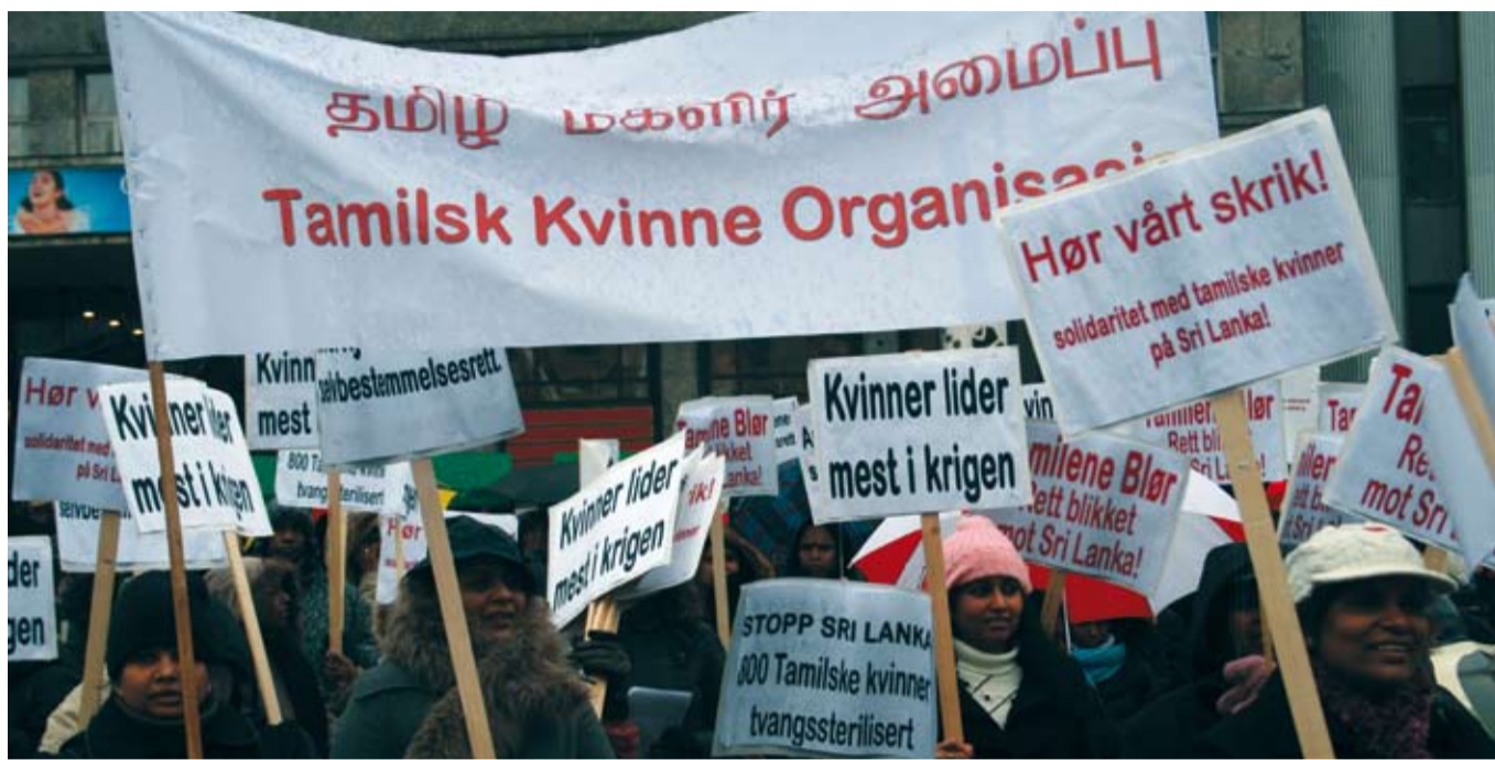
Fra 8. mars i Oslo

ønsker våpenhvile. Regjeringa i Colombo sier nei. Tigrene sier at en ensidig kapitulasjon fra tamilenes side, vil føre til etnisk rensing. Tamilene er sviktet av Norge.