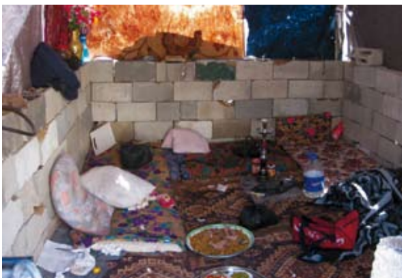
Innsiden av det nye huset.

Uttalelsen ble vedtatt med stemmene fra Rødt, SV, Ap, Sp og et flertall av Høyre. Hele Frp, KrF og Venstre stemte mot. Bevilgninga til protesteverksted gikk igjennom mot to stemmer fra Venstre og KrF.