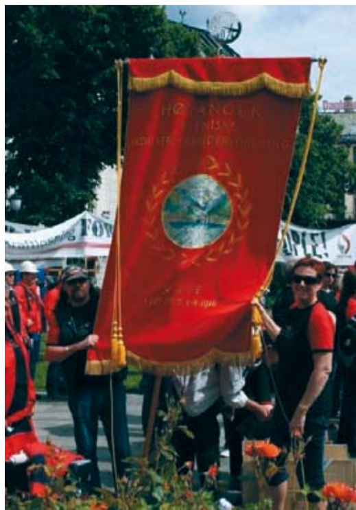
Frå ein av dei mange demonstrasjonane utanfor Stortinget, denne i 2007.

Hydro Høyanger med knapt 200 tilsette får eit økonomisk underskot på kanskje 100