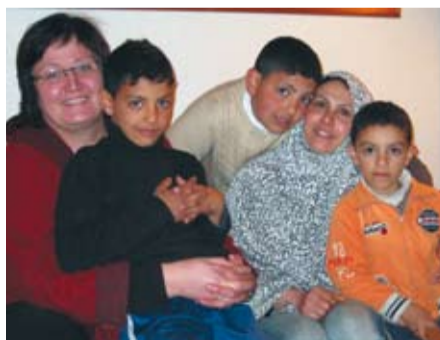
Skribenten sammen med en palestinsk familie i Raffah. Barna turte ikke å sove på rommet sitt om natten, men sov sammen med foreldrene.

Og folk er lei av hjelpesendinger og almisser, de vil ha frihet og mulighet til selv å sørge for seg og sine.