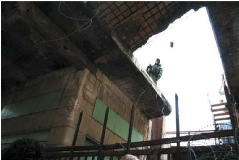
«Hvis dere ikke fjerner dere herifra, så skal jeg skape et veldig stort problem for dere!»

bråkete at flere i gruppa begynner å trekke seg unna i frykt for at det skal utvikle seg videre. Samtidig tiltrekker krangelen seg barn fra bosetningene, som kommer for å hoi med. De viser oss fingeren bak gjerdet på taket og ber oss om å dra til helvete og kaller oss jødehatere. Det gjør noe med en å se små barn hate noen så intenst og vise oss fingeren.