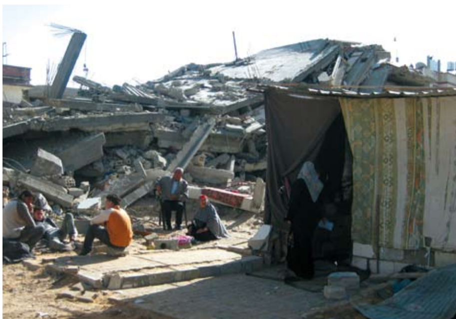
En familie nord på Gazastripen som sitter ved siden av sitt ødelagte hus. Du kan også se det nye huset de har satt opp etter å ha samlet sammen noen brukbare mursteiner og tepper.

Stengningen har ført til at prisene har steget enormt. Bankene mangler likviditet, noe som fører til at folk som har arbeid heller ikke får utbetalt hele lønna si. Det er forbudt å overføre