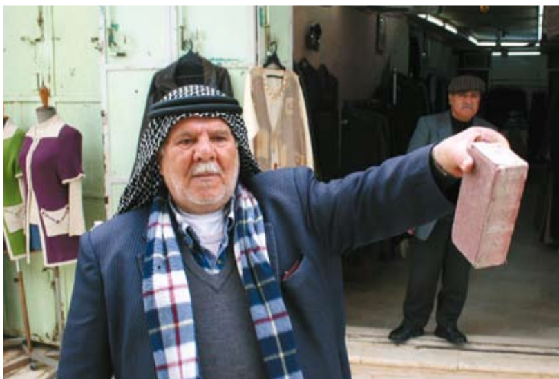
Kjøpmennene i Hebron blir daglig trakassert og blir blant annet kastet mursteiner etter.